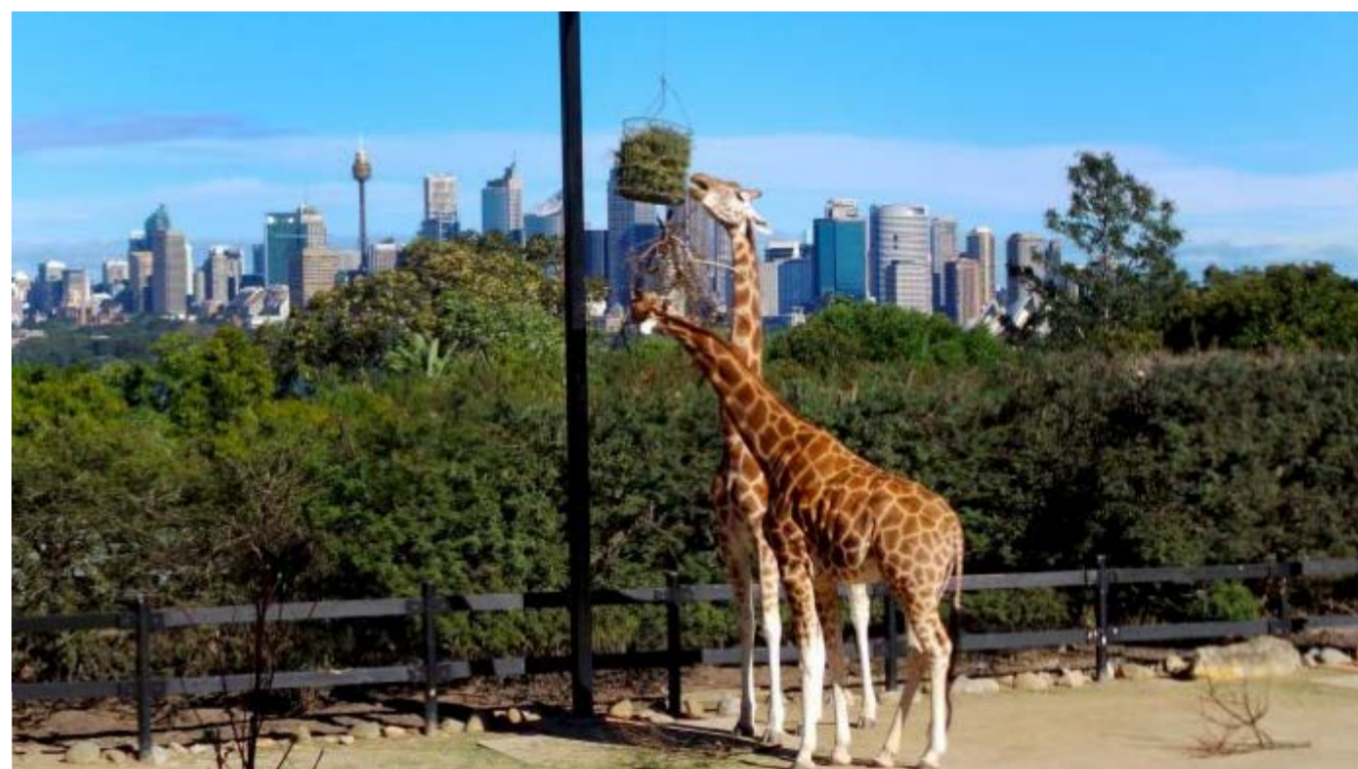
这座动物园里生活了2900多种外来及本土动物

从环形码头（Circular Quay）乘坐渡轮去动物朋友们居住的水滨家园—塔龙加动物园看望它们，这座动物园里生活了2900多种外来及本土动物，包括大猩猩、老虎、豹子、黑猩猩、长颈鹿、袋鼠和考拉，想要住宿的童鞋，请预订Roar & Snore旅游套餐，更有多种奇幻灯光秀等你来体验，在动物园里度过一个不一样的夜晚，尽在塔龙加。