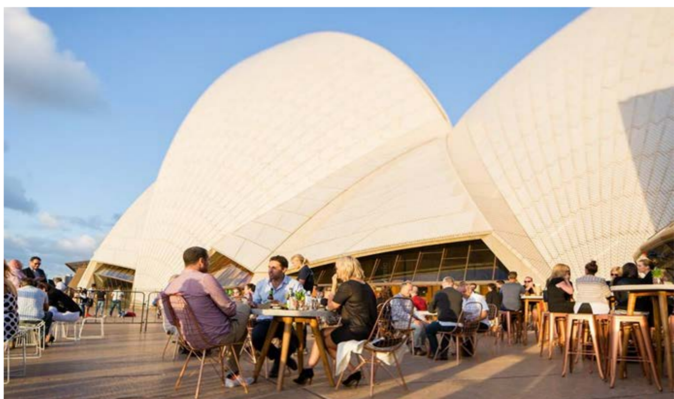
剧院特别为参加深度讲解之旅的伙伴们提供了舒适的交流创享空间