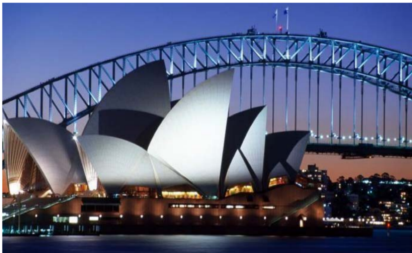
夜幕下的悉尼歌剧院唯美夺目 仿佛夜空下一颗璀璨的星

沿着环形码头漫步，寻找悉尼歌剧院永不褪色的秘密。丰富多样、日程紧凑的演出计划让歌剧院成为悉尼最繁忙的音乐、艺术和表演场馆之一，参加幕后之旅（Backstage Tour），了解歌剧院背后的工作机制，这类游览活动信息量丰富，且有包括日语、普通话和法语等多种语言讲解，为来自世界任何角落的你带来最深度最人性化的服务。